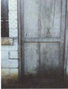
Foto1: Cambio de tres puertas