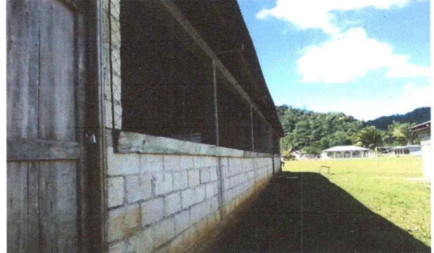
Foto 2: Colocacion de ventanas, repello y colocacion de corredor.